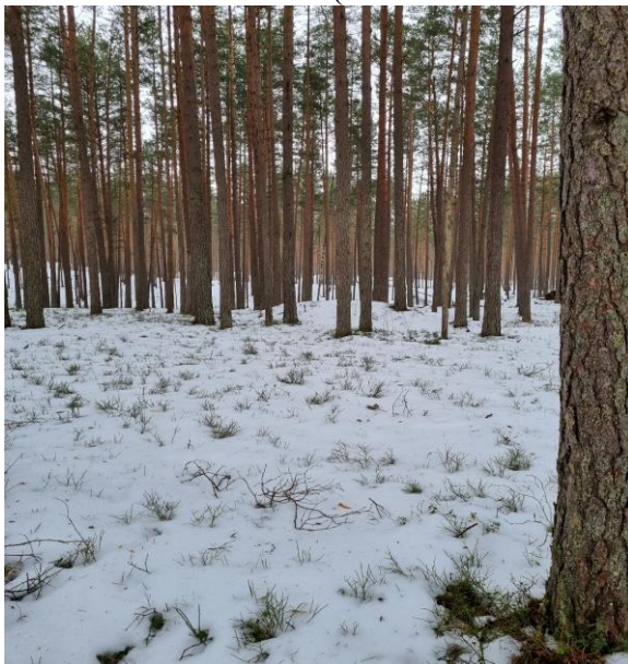
(unikalus kodas Kultūros vertybių registre 5699)